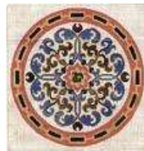
esempio di ricamo su stoffa

trattava di una prerogativa maschile, tuttavia c'erano anche presenze femminili tra cui religiose e donne nobili. Infatti, si trattava di un passatempo per nobili donne e regine come Caterina de Medici, Elisabetta d'Inghilterra, per le quali vennero pubblicati i primi libri di modelli di ricami.