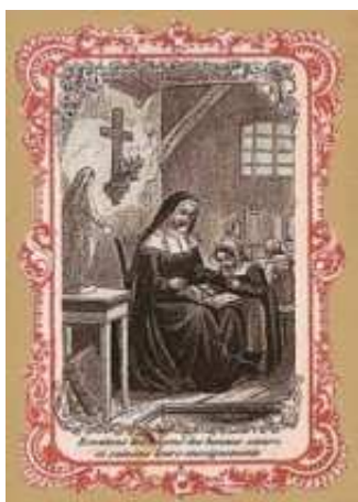
Suora-maestra con una bambina

Nella nostra provincia, ma anche nella città di Bari, alcuni istituti religiosi si distinsero per i lavori eseguiti, tra questi vale la pena citare nella città di Bari nel Conservatorio della SS.ma Annunziata , governato da alcune Religiose non professe, oltre all'educazione religiosa e morale, le bambine venivano istruite "nel leggere, scrivere, ed abaco, e nei lavori come quello di ben cucire, di fare calzette di qualunque sorta, di filare finissimo filo di lino, cotone e anche di lana, di fare bottoni di filo di varie sorte per camice, far limacce e fettucce di filo di qualunque manifattura, nei passati tempi vi era anche la scuola di ricamare e far pizzilli " 3 .