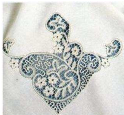
Esempio di pizzo

incominciarono ad eseguirsi particolarissimi lavori come il pizzo 4 .