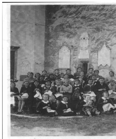
Corso di economia domestica 1955

Come non è più previsto l’insegnamento di economia domestica nei programmi scolastici,